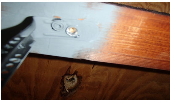
Foto 2. Uit nadere inspectie bleek dat deze noniushangers bevestigd zijn met rvs schroeven. Aangezien een ketting zo sterk is als de zwakste schakel, kunnen deze schroeven breken wegens spontane scheurvorming. Daarom is deze ophangconstructie afgekeurd. Volgens EN 13451 is het ook verboden om RVS te coaten. Het feit dat deze schroeven zijn gecoat met zinkspray was erg misleidend, maar is wel opgemerkt door de inspecteur.

Foto 1. Het plafond en de TL armaturen hangen aan noniushangers. Dit is een prima oplossing die bekend staat onder de naam: "staal met een duplexcoating". Op deze hangers zitten twee coatings, namelijk metallisch zink en verf.